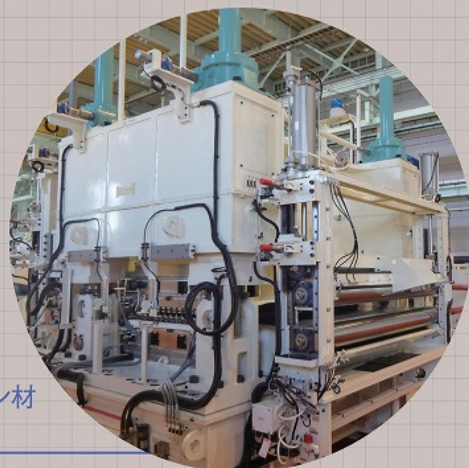
ウルトラハイテン材 対応レベラ