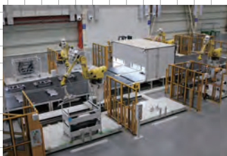
ビジョン式オートパレタイザ