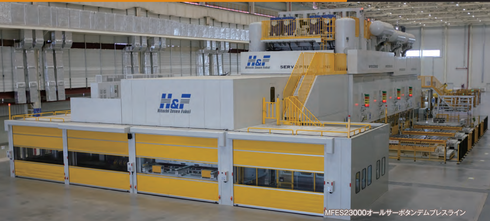
MFES23000オールサーボタンデムプレスライン