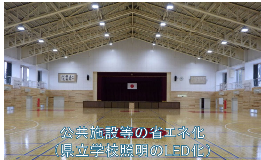
公共施設等の省エネ化 (県立学校照明のLED化)