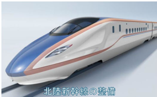
北陸新幹線の整備