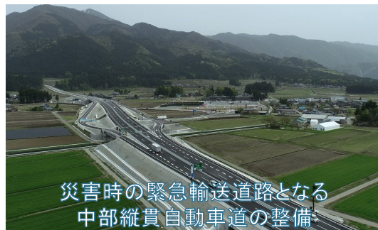
災害時の緊急輸送道路となる 中部縦貫自動車道の整備